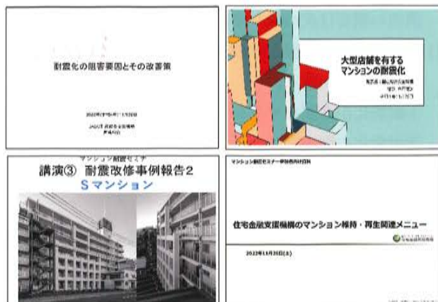
セミナー資料表紙

オンライン (Zoom 等) によるセミナーの開催が定着しつつあり、参加者の操作や視聴に関する問題は無かったようにみられる。また音声・画像に対する苦情も無かったようなので、概ね良好な発信ができたと思われる。