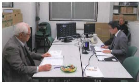
セミナー撮影スタジオ 全景

今回の「マンション耐震セミナー」開催は、新型コロナ禍の影響によりオンラインセミナーとし、7月頃から JASO 教育研修委員会メンバーと事務局で新たなセミナーの開催の仕方を模索してきた。