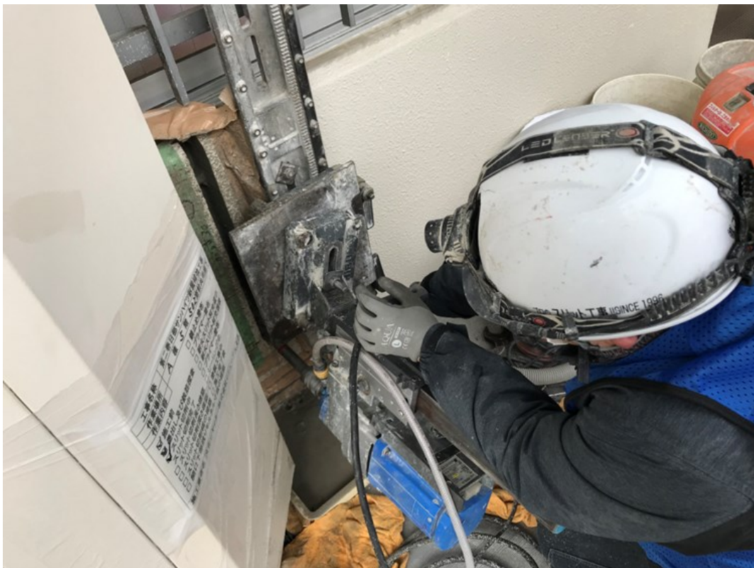
ノンピック工法によるスリット施工