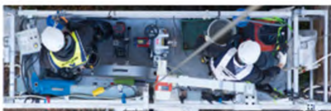
(上段左) Gondola足場 (上段中) 養生フラップ (上段右) ウォールソーカッター (下段) Gondola内部